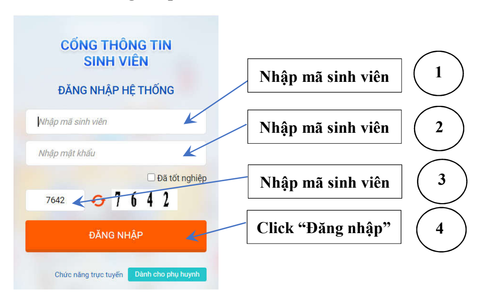
Hình 1: Đăng nhập website: http://sinhvien.uneti.edu.vn/